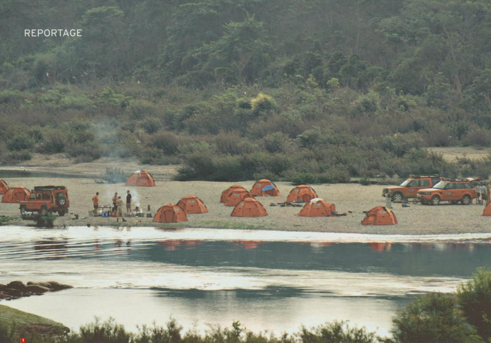
1 ABENDS SCHLAGEN DIE TOURENSUCHER IHR CAMP AM FLUSS AUF 2 DER WAGEN BEWÄLTIGT DEN ANSTIEG AUF DER SCHLAMMIGEN PISTE NUR MIT MÜHE 3 DER KONVOI WAR VOR ALLEM FÜR KINDER EIN SPANNENDER ANBLICK 4 DIE GRUPPE DISKUTIERT DIE ROUTE