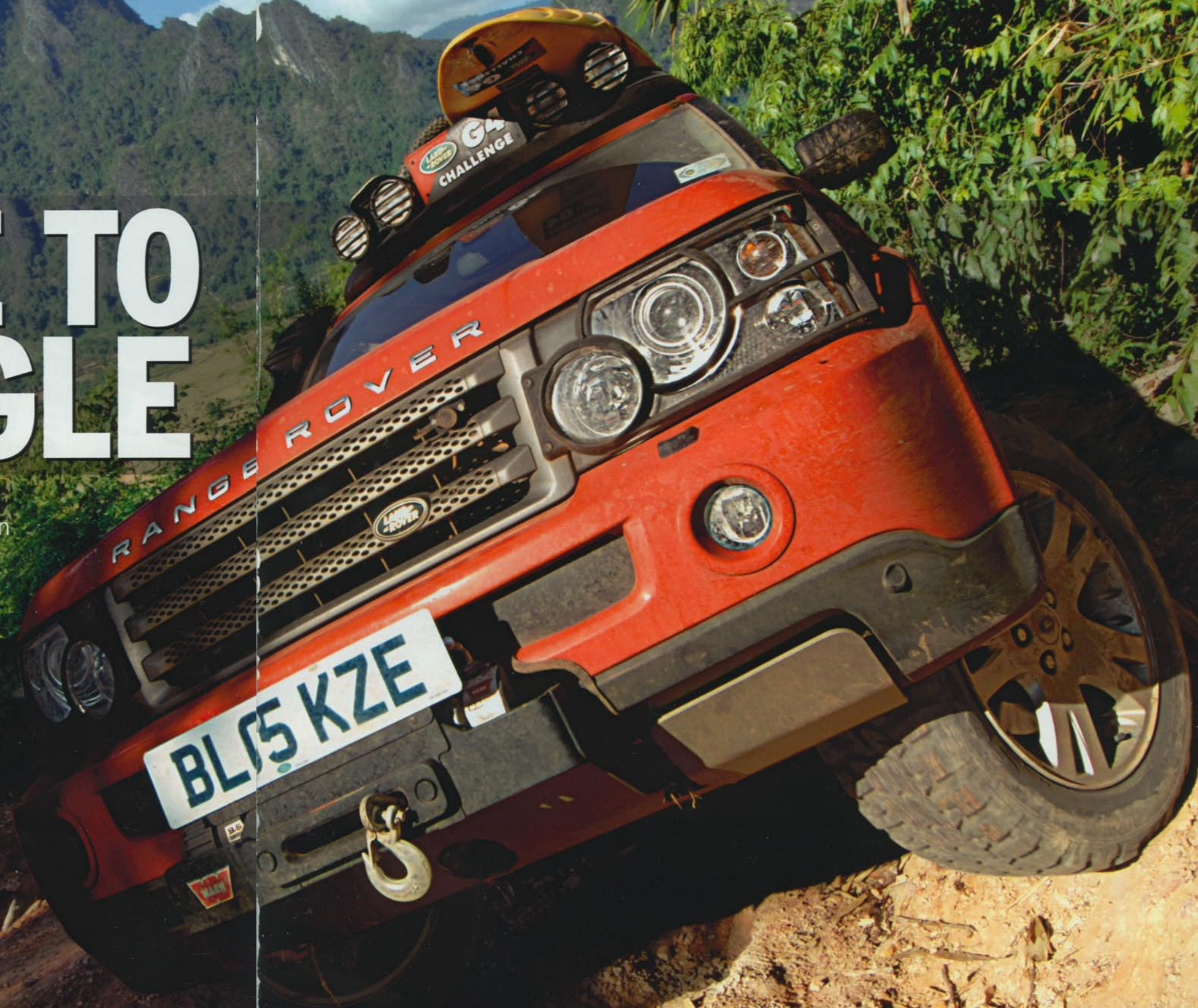
Nur nicht kippen: Der Fahrer des Range Rovers lotet die Grenzbereiche aus