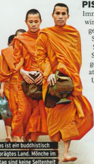
... ist ein buddhistisch geprägtes Land. Mönche im Alltag sind keine Seltenheit

»Wir geben weiter Gas. Schlittern durch Staub. Schlucken Schlamm«